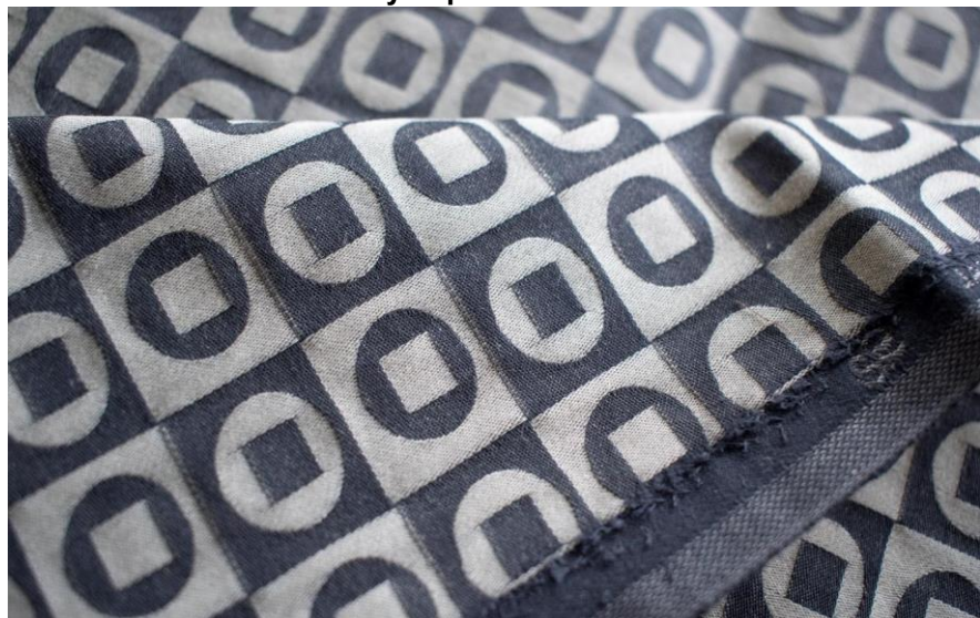
Obrázek 2: Vlastní rezná tkanina utkaná na základě výstupu z EAT